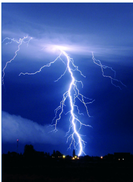
Abb. 1: Blitze

gesonderten Artikel berichtet werden) scheinen hier die Begründung für die stärkeren Effekte der Lokalanästhetika mit Amidstruktur sein, zu welchen auch Lidocainhydrochlorid zählt. Insbesondere Taubheitsgefühle von Nerven nach chirurgischen Eingriffen (Numbing) auch Lähmungen einzelner Muskelgruppen bildeten sich hier mehrfach in der gleichen Sekunde zurück. Dies steht zwar im Widerspruch mit der bisherigen Meinung, dass Procainhydrochlorid das Mittel der ersten Wahl auch bei Narbenentstörung sei, wurde aber in meiner Praxis in sehr vielen Fällen, die mit Procainhydrochlorid anderweitig und auch technisch korrekt vorbehandelt waren, immer wieder so beobachtet. Insofern muss festgestellt werden, dass Mepivacainhydrochlorid im Zusammenhang mit der Narbenentstörung offensichtlich die wirksamere Substanz ist. Allergische oder schwerwiegende Kreislauf-Nebenwirkungen traten bei über 15.000 Injektionen kein einziges Mal auf. Die Beschwerden verschwinden oft für einen Zeitraum von vielen Tagen, Wochen und Monaten, können ggf. erneut auftreten und verschwinden nach erneuter Behandlung der entsprechenden gestör-